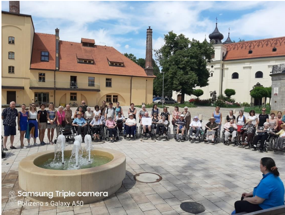
© Samsung Triple camera © Pořízeno s Galaxy A50