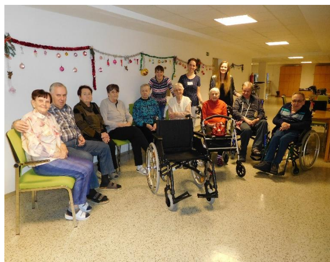
Pozdrav sponzorovi za invalidní vozík Caneo B (v hodnotě 15 tis.)